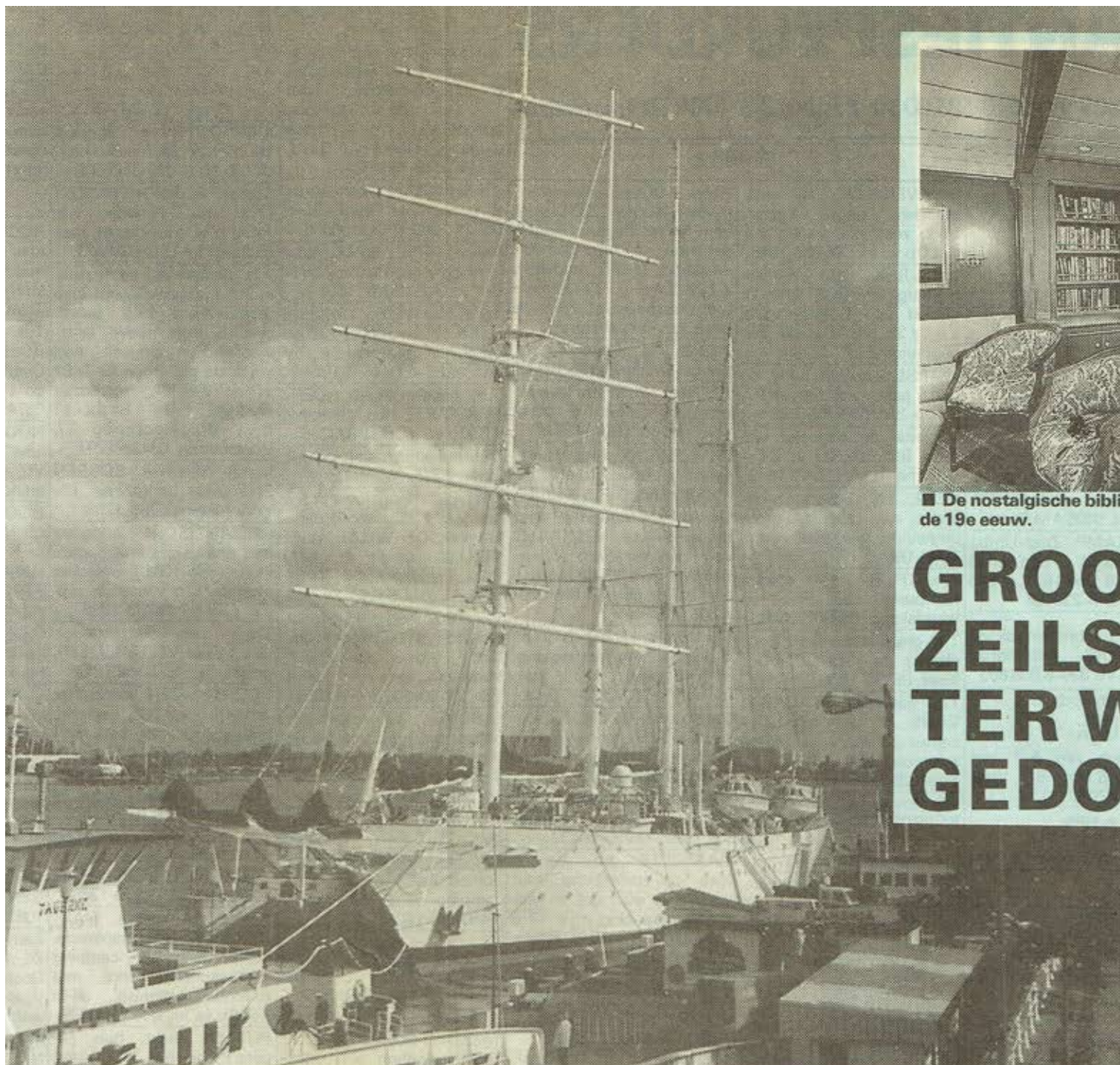
■ De „Star Flyer” in de haven van Antwerpen.